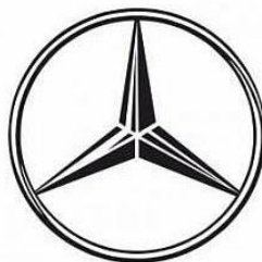
Abbildung 2: Markenlogos von BMW® und Mercedes Benz®