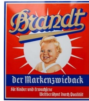
Abbildung 1: Beispiele bekannter Marken